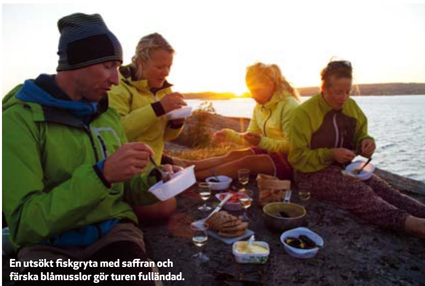
En utsökt fiskgryta med saffran och färska blåmusslor gör turen fulländad.

ter, som har en förmåga att skapa ljusutveckling. Det kallas bioluminiscens och finns även hos eldflugor och lysmaskar. I det dunkla ljuset uppfattar vi det som en rörelse i vattnet. Vi har upplevt vårt första möte med de märkliga organismerna som lever i havet, redan innan vi lagt i kajakerna.