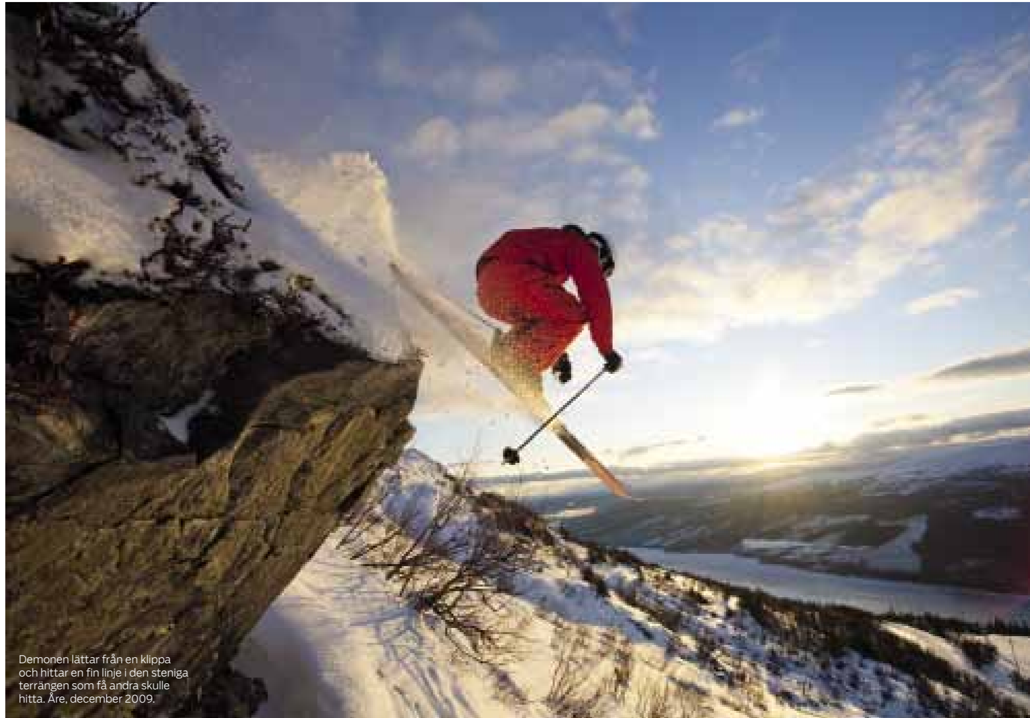
Demonen lättar från en klippa och hittar en fin linje i den steniga terrängen som få andra skulle hitta. Åre, december 2009.

man bara någon meters sats ifrån drivan, men han kom med fart med sig från traversen på en super-G-sväng och sedan en rak linje över kanten. Bara den sista raka linjen var 50 meter lång och det gick väldigt fort över kanten. Det var heller inte så att han dämpade i uthoppet utan han sköt ifrån det han hade på kanten”, berättar Reine, som var en av dem som var med och såg hoppet.